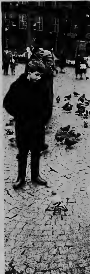
Mescos qu e hopi habitantenan gusta bai busca reposo banda background por mira Paleis.

Despues qu e diplomanan a ser entrega, e antillanonan qua slaag a keda largu ratu reuni y naturalmente Corsow tabata e tema principal di nan combersacion.